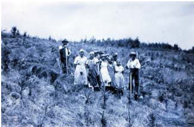
Seegrasverarbeitung, Seegrasrupfer 1932, Immelstetten

Beim Hutner „ Altbauer “ jetzt unter anderem Wohnanlage Laugnapark, wurde überwiegend im Waldbereich „Alter Schlag“ gerupft und gesichelt. Zum