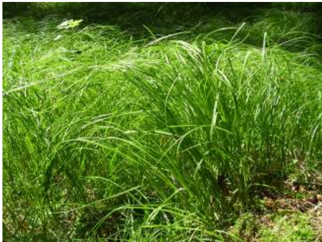
Seegrass am Wegrand im Stättnerwald bei Emersacker