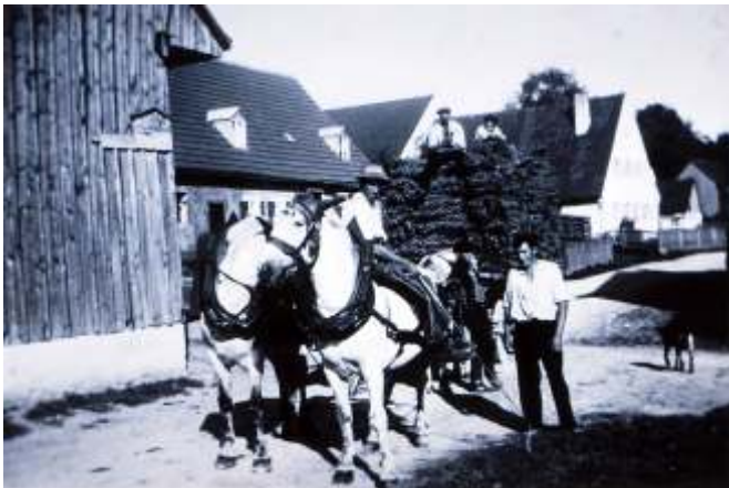
Seegrasverarbeitung, Pferdefuhrwerk mit gesponnenem Seegras in Rettenbergen.

Allgemein wurde das ca. 1,20 m lange Seegras so „behandelt“ wie das Heu. Also nach dem Rupfen aufstreuen, schlauen, anstreuen bis es trocken war. Dann wurde es in überdachten Schupfen oder in Stadelviertel (eingetrappt) bis zur Weiterverarbeitung gelagert.