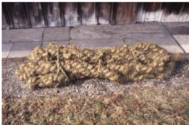
Seegrasverarbeitung, Originalseegrasbund von 1965, bestehend aus 6 Zöpfen

Das Spinnen geschah meist im Stadel und die Länge des