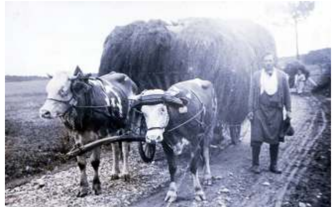
Seegrasverarbeitung, Fuhre mit losem Seegras auf dem Weg zum heimischen Anwesen, 1947 - 48

wurde mit einem Kuh- oder Ochsespann oder mit einem einfachen Leiterwagen aus dem Wald abtransportiert und nach Möglichkeit im Stadel gelagert. Für die Verarbeitung hatte man erst im Herbst oder Winter Zeit“.