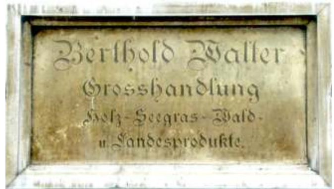
Berthold Walter Großhandlung Holz- Seegras Wald u. Landesprodukte. Augsburg Lit. D 29 heute Philippine Welser- Str. 13

In Welden standen zwischen Bahnhof und Kirche an den Samstagen oft 15-20 mit Seegras beladene Fuhrwerke.