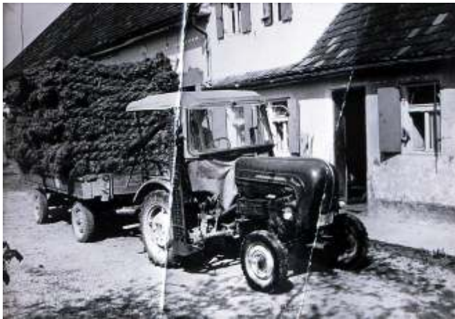
Seegrasverarbeitung, Eine Fuhre mit 25 bis 30 Zentnern gesponnenem Seegras, aufgenommen 1957 - 58 in Reutern

Das Gras wurde im Allgemeinen von Frauen gerupft. In der Hitze war das eine sehr anstrengende Arbeit und dann auch noch die lästigen Schwärme Blut saugender Insekten. Die Frauen mussten gleichzeitig ihre Kinder betreuen. Für die Kleinsten wurde ein Tuch ausgebreitet, und ein Regenschirm als Sonnenschutz aufgespannt. Die größeren Kinder ab circa fünf Jahren mussten die gerupften Seegrasbündel zum Trocknen an eine waldfreie Stelle bringen. Das getrocknete Seegras