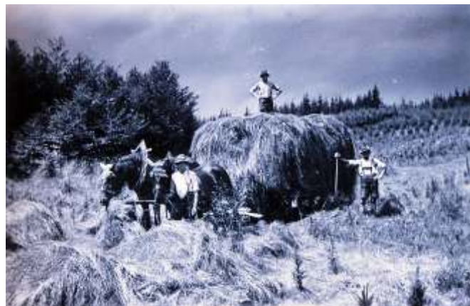
Seegrasverarbeitung, Fuhrre mit frischem Seegras, Pferdefuhrwerk, ca. 1938/39 bei Immelstetten

mit dem Förster einen Vertrag über das Verarbeiten von sogenanntem Splitterholz („Spätfolgen“ von Bombenabwürfen aus dem 2. Weltkrieg) als Brennholz.