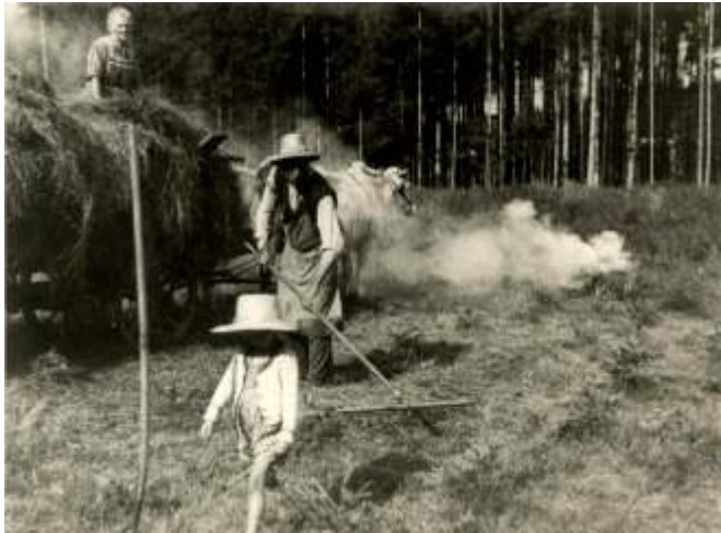
Seegrass holen, Kleinlandwirt Müller mit Frau u. Kind, Rauchtopf zur Abwehr der Bremsen, um 1943

hatten noch die Seegrassschuhherstellung erlernt. Sie fertigten mit dünnen Seegraszöpfen auf einer Schusterleiste Seegrasschuhe. Die Schuster Dora, in Affaltern geboren, kam als junges Mädchen zum Leix nach Lauterbrunn in den Haushalt. Sie war eine gute