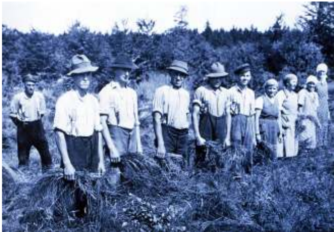
Seegrasverarbeitung, Seegrasarbeiterinnen und Arbeiter, aufgenommen während des zweiten Weltkrieges

das entwich nach dem Verladen in mächtigen Dampfvolken. Ausbezahlt worden war jedoch bereits am Samstag und zwar in bar. Das Geld blieb zum Teil oft gleich in der Bahnhofswirtschaft."