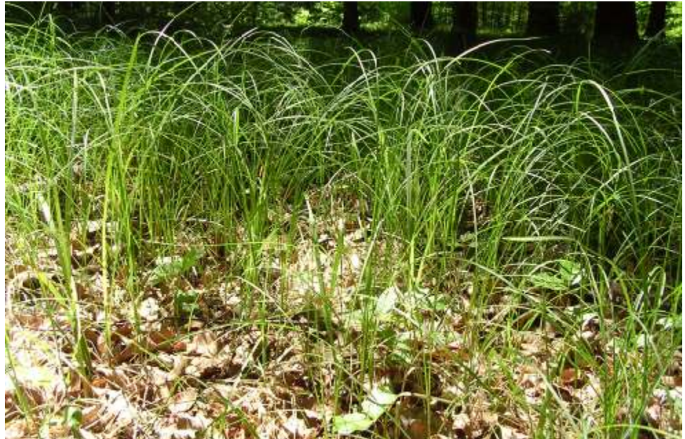
Wald-Seegras im Stättnerwald zwischen Emersacker und Lauterbrunn, Mai 2010

Um 1930 wurde aus Nordamerika eine Pilzkrankheit eingeschleppt, welche die Seegrasbestände in der Nordsee vernichtete.