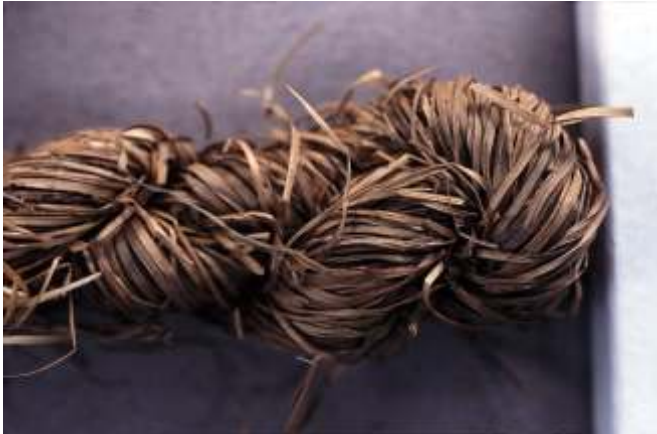
Seegrasverarbeitung, verdrehter Seegrasstrang