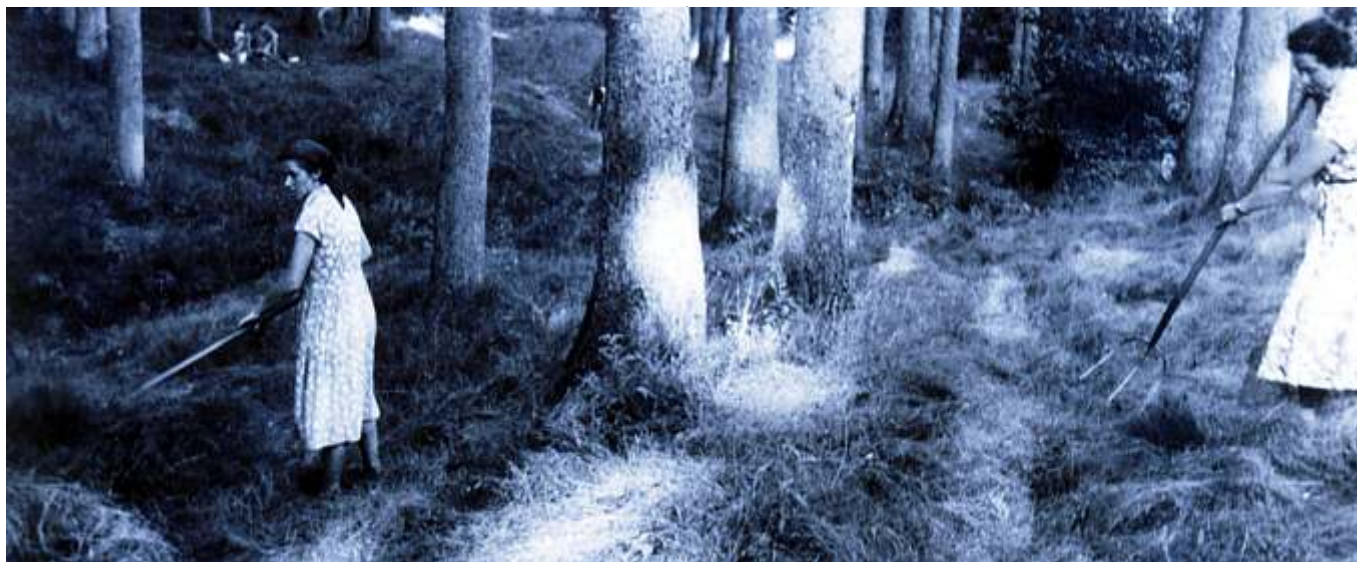
Zwei Frauen bei der Seegrasverarbeitung im Wald

immer schon waren, mischten gelegentlich, um ihren Verdienst etwas aufzubessern, Backheu an das Seegras. Backheu nannte man den minderwertigen Bewuchs, den Sumpf- und Moorwiesen hergaben. Mit diesen Gewächsen streckten sie die Menge des Seegrases etwas. Andere versuchten das Gewicht der Ware dadurch zu erhöhen, dass sie die fertigen Stränge noch kräftig mit Wasser übergossen. Doch die Abnehmer, die Händler, ließen sich nicht so leicht übers Ohr hauen und manchmal ging der Schuss nach hinten los.