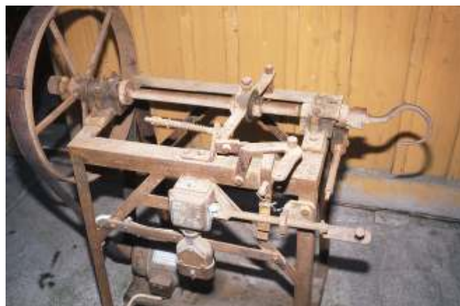
Seegrasverarbeitung, Elektrische Seegraspinnmaschine in Bonstetten, gekauft nach dem zweiten Weltkrieg

Als Bub habe ich noch öfters beim Anwesen „Rösch“ beim Spinnen helfen dürfen. Der Lohn betrug meist 50 Pfennige für einen halben Tag. Das war damals ein hoher Lohn und ich war sehr traurig, als sich mein