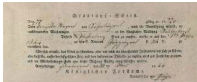
Seegras=Rupfschein von 1844

Nach dem 2. Weltkrieg, im Mai 1946 wurde die Bewirtschaftung erneut angeordnet. Durch diesen Umstand sind die Erträge ab diesem Zeitpunkt gut dokumentiert.