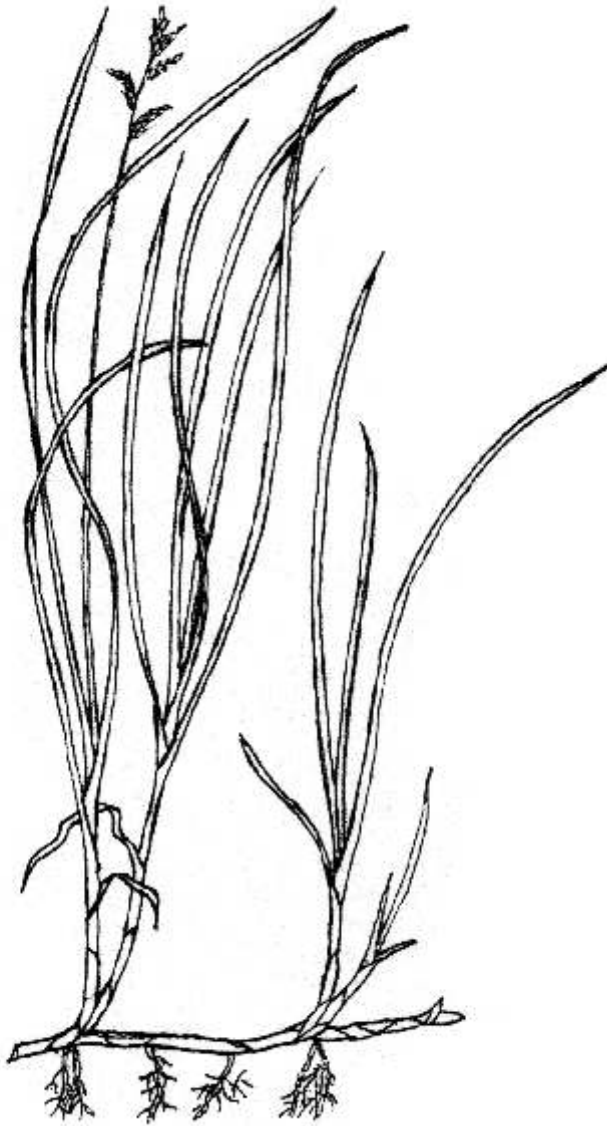
Zittergras-Segge Carex brizoides