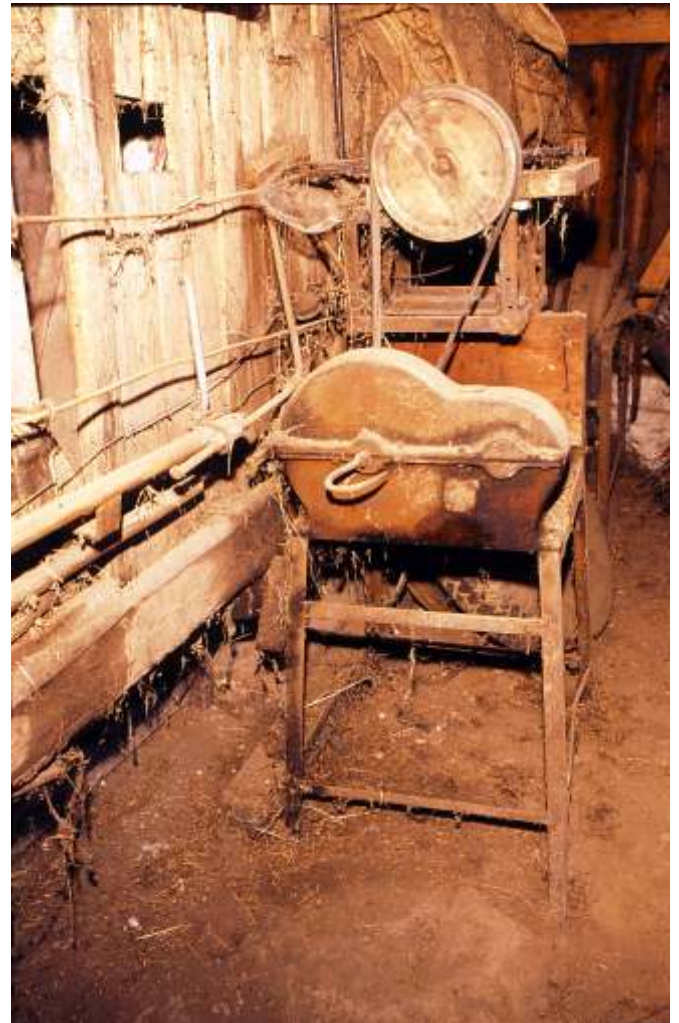
Seegrassverarbeitung, eine elektrisch angetriebene Seegrassmaschine, Neuburg an der Kammel

Das Seegrass wuchs vor allem auf Kahlhiebflächen im Wald und an den Waldrändern. Nachdem in Emersacker nahezu alle Wälder der Fugger'schen Stiftung gehörten, hat diese das Seegrass unter den Interessenten versteigert.