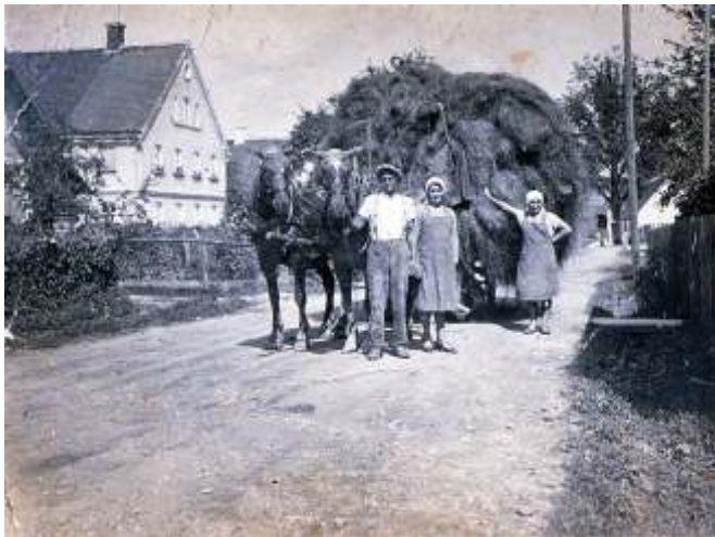
Seegrasverarbeitung, Fuhre mit ungesponnenem Seegras auf dem Weg zum heimischen Anwesen, 1934

Oder nach der Erinnerung einiger Fußballspieler des kurz zuvor gegründeten Sportvereins Adelsried: In der