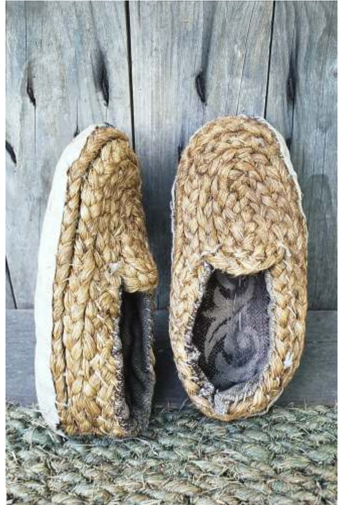
Seegrasverarbeitung, ein altes Paar Seegrasschuhe ca. 1946, Kreisheimatstube Lkr. Günzburg Stoff