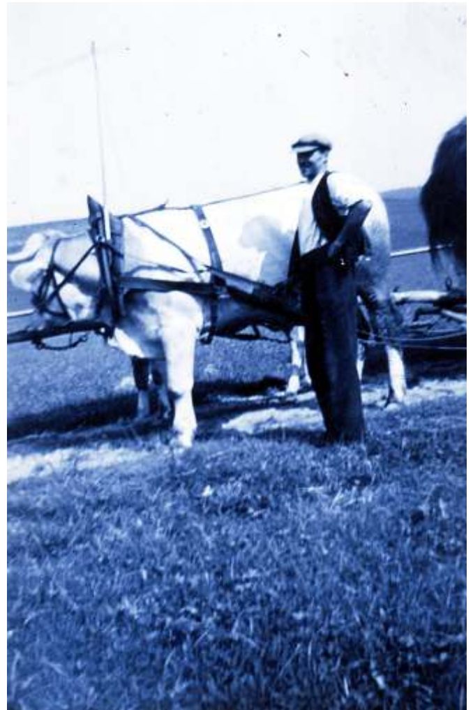
Seegrasverarbeitung, Ochsenfuhrwerk zum Transport von Seegras