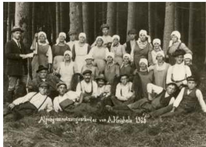
Alpengrasnutzungsarbeiter von A. Heichele, um 1926

Bei diesem Grasrupfschein könnte es sich neben Seegras auch um Gras für Viehfutter handeln. Für Kleinst-Landwirte mit einer Ziege oder einer Kuh wurden solche